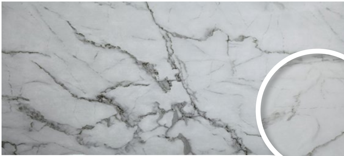
CARRARA • SMM11