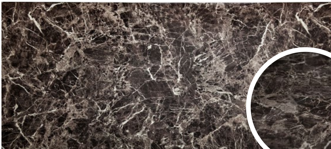
MARROM IMPERADOR • SMM13

Tamanho: 120 x 60 cm • Espessura: 2 mm • Peças por caixa: 6 • Metragem: 4,32 m 2 • Peso caixa: 16,5 kg